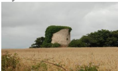
Abandonnées, les ruines de moulins subissent les aléas du temps

Même si quelques rares moulins à vent ont tourné jusque dans les années 50/60, cela fait donc plusieurs décennies qu'ils n'animent plus le paysage par le majestueux tournoiement de leurs ailes. Cependant le vent, lui, souffle toujours... et il fait désormais tourner des éoliennes pour produire de l'électricité, cette énergie si nécessaire et si demandée par notre économie ultra moderne mais très consommatrice.