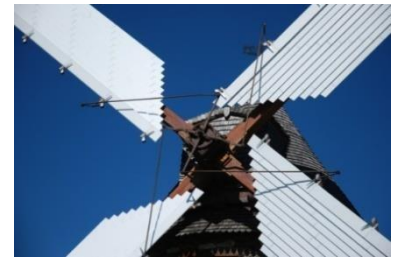
Les ailes à système Berton

Par conséquent, durant plusieurs siècles, l'évolution de la technique permit de satisfaire à des besoins variés et à des productions allant toujours croissantes.