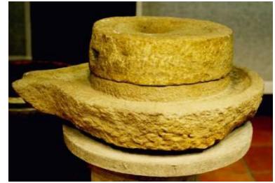
Meule à main primitive

Alors, des questions peuvent parfois venir à l'esprit : ce moulin ne pourrait-il pas retrouver des ailes pour s'orienter vers une nouvelle vie ?... Et participer à nouveau pleinement à l'économie du pays dans le secteur économique qui lui est le plus vital, à savoir celui de l'énergie ?